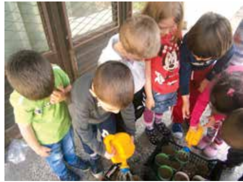
Во сите осум основни училиш-

та и во двете детски градинки на територијата на Општина Аеродром успешно се реализираше акцијата „Садница плус“ во соработка со здружението „Ден на дрвото“ и Министерството за животна средина.