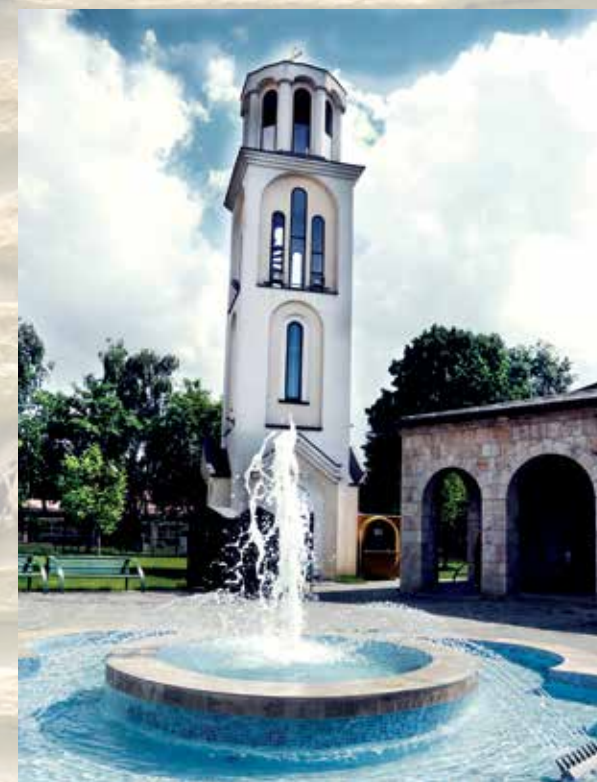
„Црква Св. Илија“ - Милена Мекич