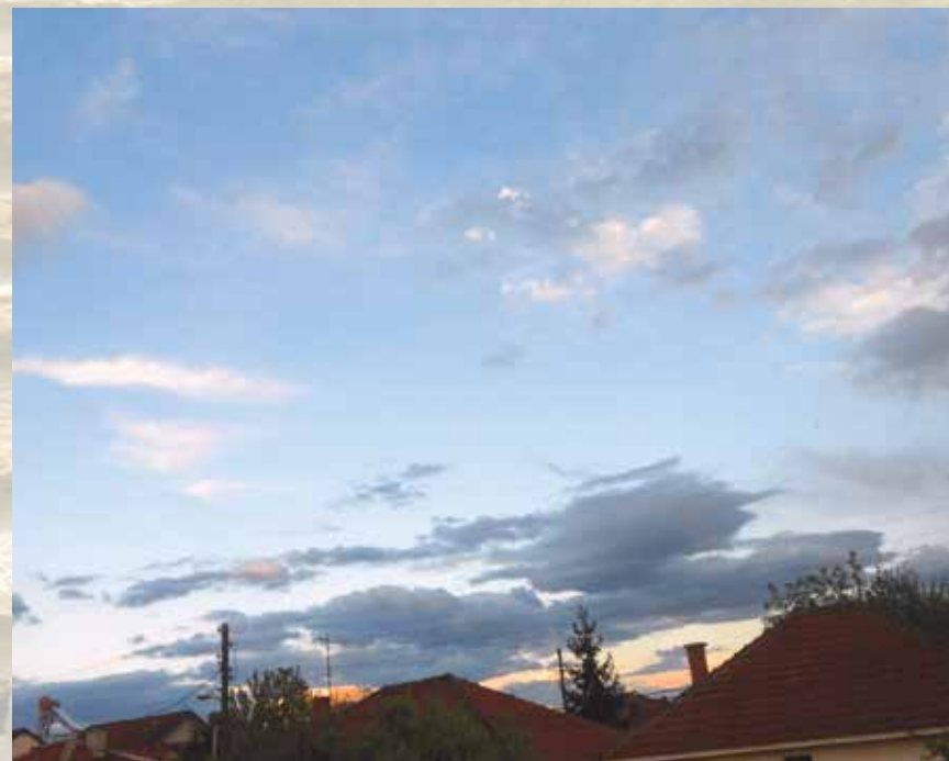
„Небо“ - Дијана Цветкоска