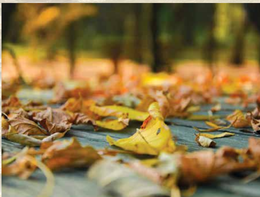
„Есен во Аеродром“ - Алекс Спасов

ПОКРАЈ ФОТОГРАФИЈАТА, ТРЕБА ДА СЕ НАВЕДЕ НАСЛОВОТ, ЛОКАЦИЈАТА И ИМЕТО НА АВТОРОТ.