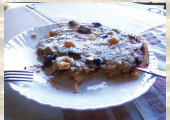
„Летна пица“ - Игор Пејиќ