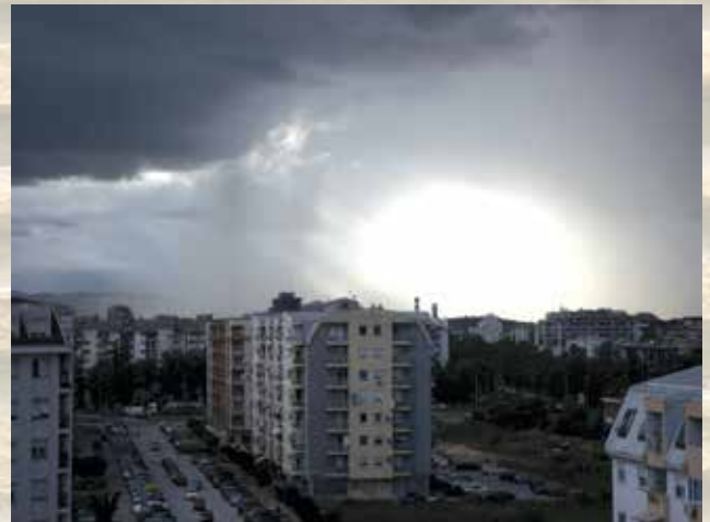
„Небо над Аеродром“ - Роберт Колев