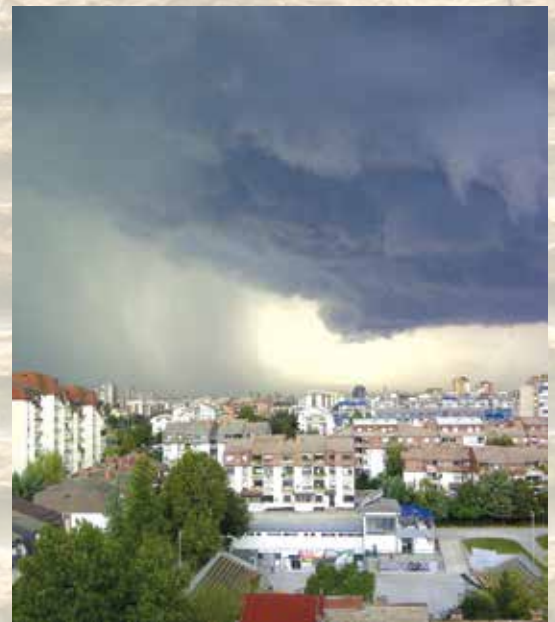
„Невреме над стадионче“ - Ангела Зафировска